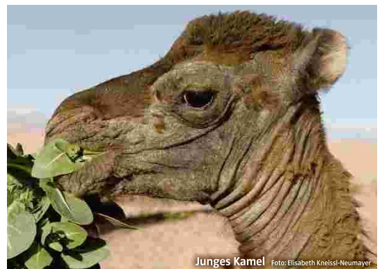
Junges Kamel

Ein Erlebnis der besonderen Art, das man sich auf alle Fälle in Marokko gönnen sollte, ist eine Übernachtung in