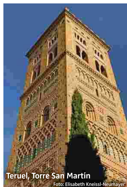
Teruel, Torre San Martín