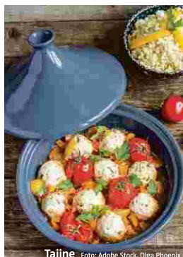
Tajine

Ein idealer Begleiter für eine Reise ist immer ein gutes Buch – u. a. „Die Stimmen von Marrakesch“ von Elias Canetti oder „Himmel über der Wüste“, im Original „The Sheltering Sky“, von Paul Bowles (der Tanger verfallen war) oder „Das nackte Brot“ von Mohamed Choukri und „Das Schweigen des Lichts“ von Tahar Ben Jelloun.