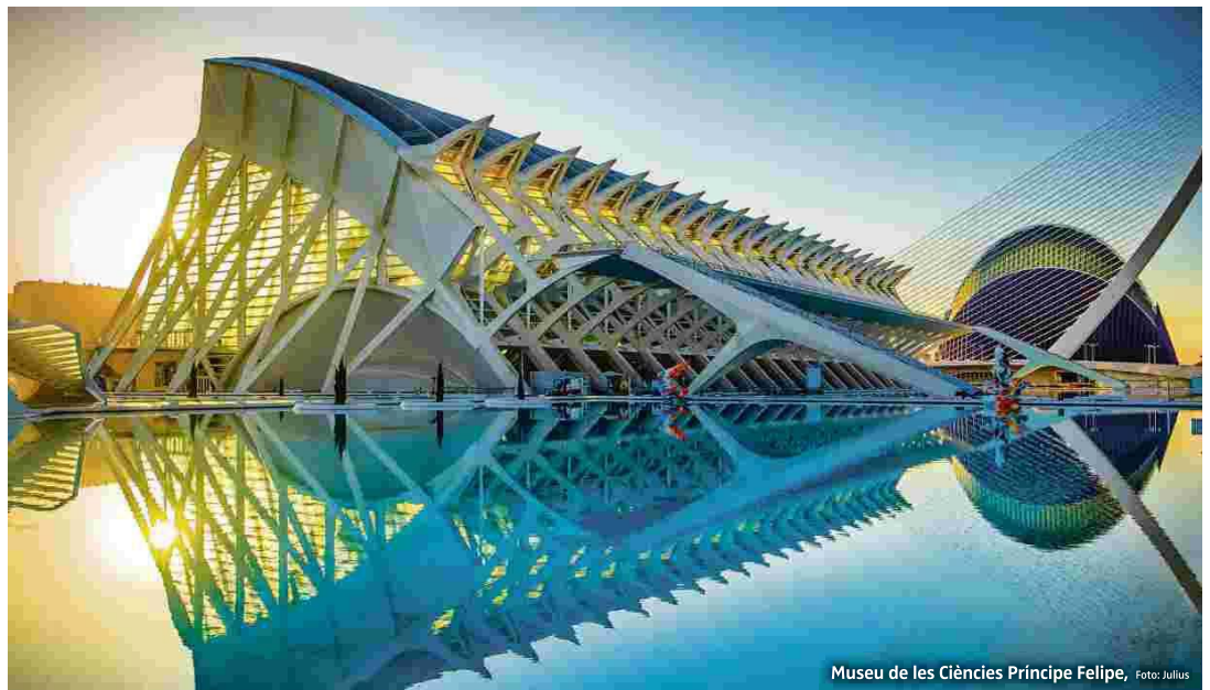
Museu de les Ciències Príncipe Felipe

Zwischen der Placa de la Mare de Déu und den beiden alten Stadttoren Porta de Serrans und Torres de Quart erstreckt sich eines der beliebtesten Ausgehviertel von València – das Barrio del Carmen, schlicht El Carme genannt. Hier findet man nicht nur altherwürdige Paläste, einzigartige Museen (u. a. das Museum Moderner Kunst – IVAM) und die beeindruckenden Deckenfresken der Kirche San Nicolas de Bari, hier schlägt auch das Party-Herz der Stadt mit Restaurants, Bars, aber auch Discos. Inmitten der Stadt erhebt sich La Seu, die Kathedrale von València, errichtet ab dem 13.