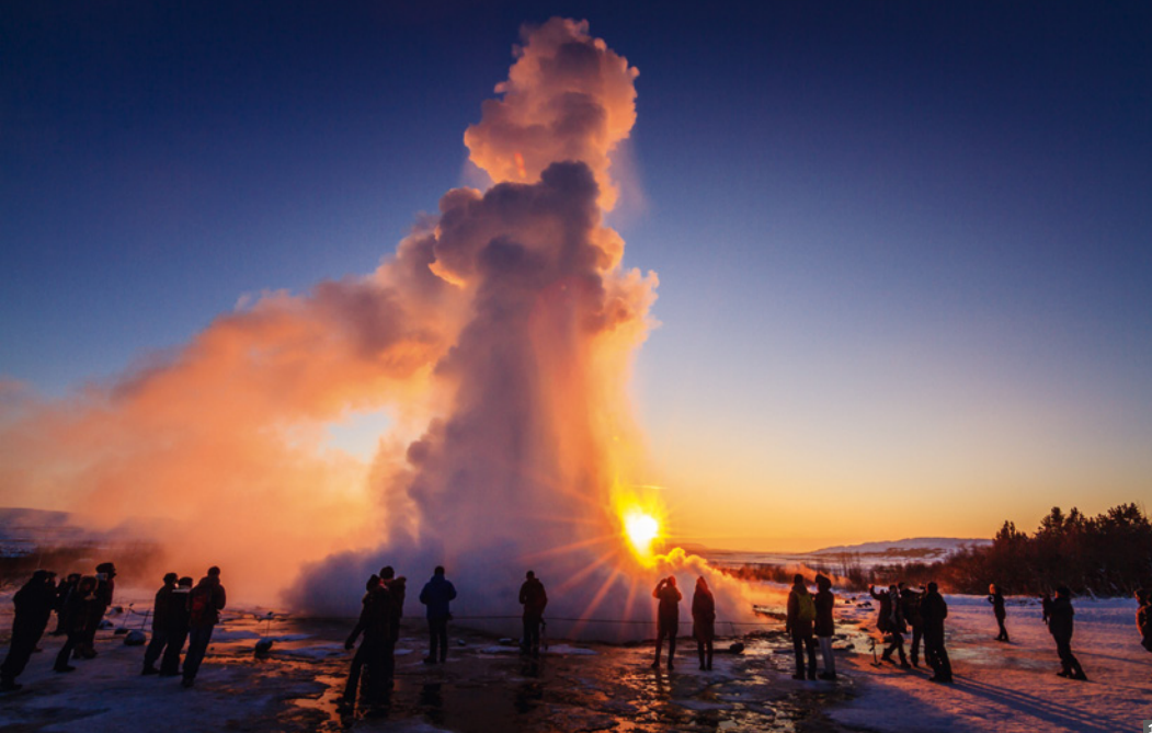
1 Geysir