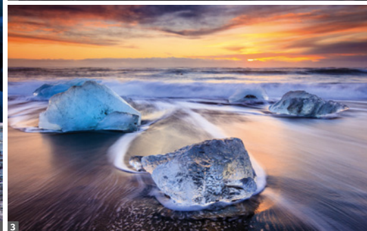
1 Gletschertour © Prof. Sepp Friedhuber 2 Vesturhorn © Stefan Brenner 3 Eisschollen, Jökulsárlón © Stefan Brenner