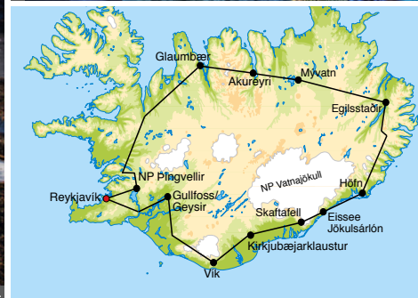
1 Vatnajökull 2 Reykjavík, Hallgrímskirkja