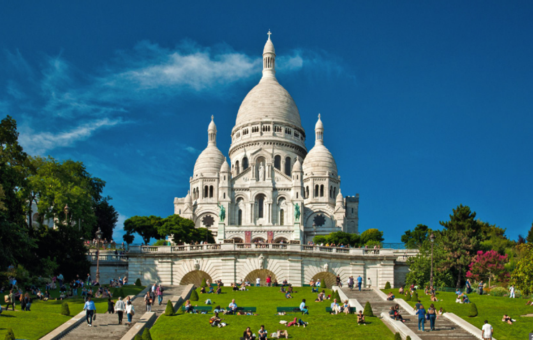
1 Sacre Coeur