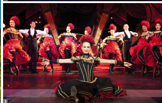
2 Louvre © Atout France 3 Paradis Latin © Atout France

StudienErlebnisreise mit Flug, Transfers, ***Hotel/NF und Stadtbesichtigungen zu Fuß und mit der Metro