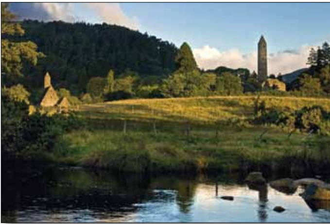
Glendalough inmitten der Wicklow Mountains