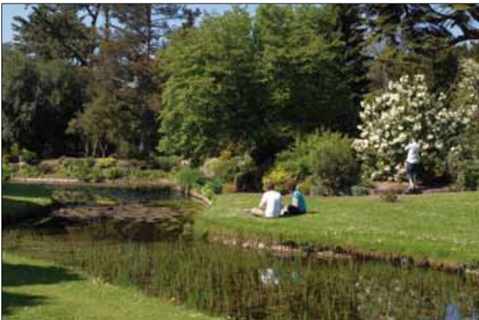
Dublin, Botanischer Garten