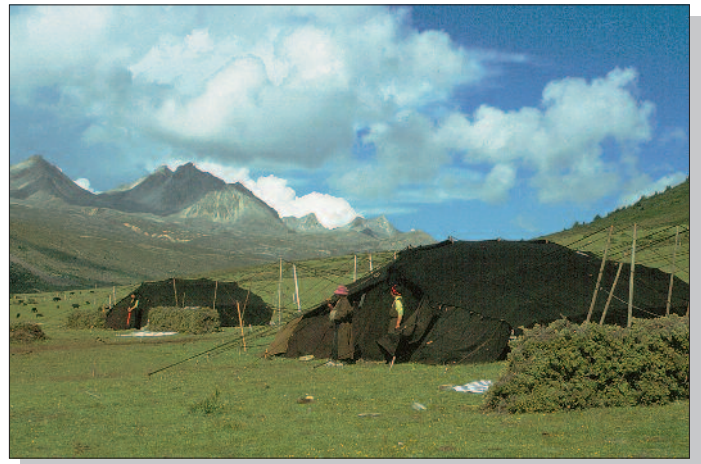
Nomadenzelte in Kham