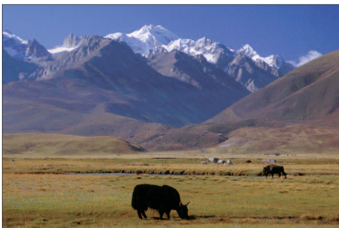
Yak vor dem Trori Dorje Ziltrom

13. Tag: Yushu - Shiwu - Sersshul - Shiqu. Wichtigste Sehenswürdigkeit von Yushu ist das Kagyupa-Kloster Dondrubling, das wir am Morgen besichtigen. An-