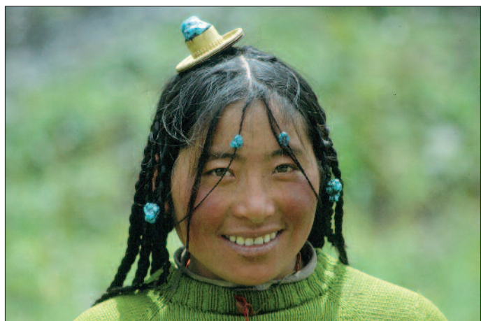
Frau aus Derge