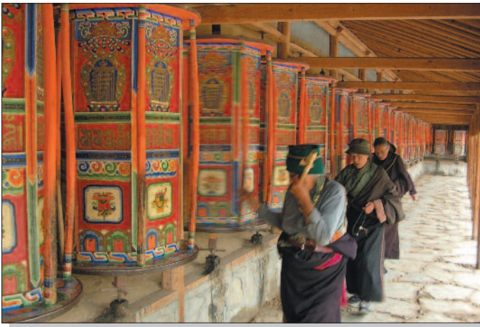
Gebetsmühlen im Kloster Labrang