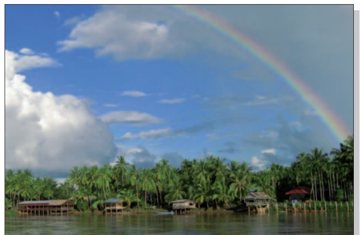
Insel Don Khong im Mekong