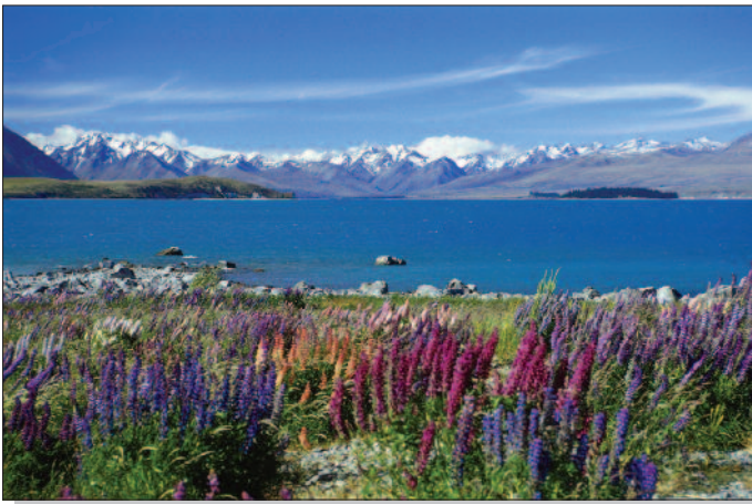
Lake Tekapo, Südinsel