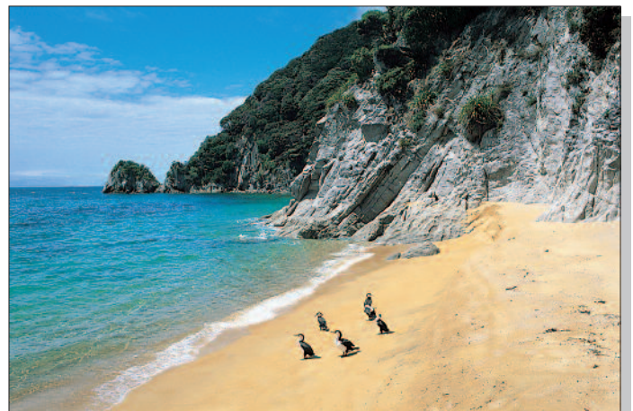
Küstenlandschaft im Abel-Tasman-Nationalpark, Südinsel