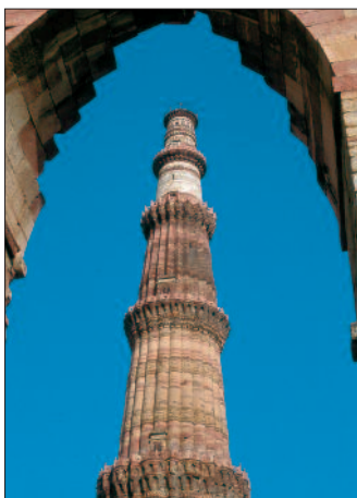
Delhi, Qutb Minar

Hotelunterbringung: wie rechts 'Höhepunkte Nordindiens'