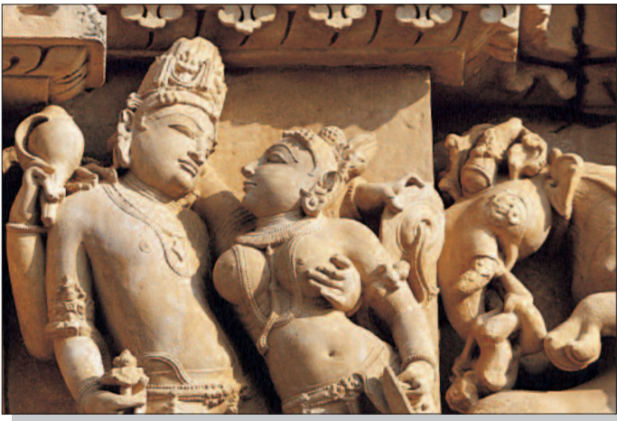
Khajuraho, Detail der Reliefs der Chandela-Tempel