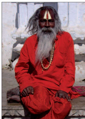
Sadhu in Varanasi