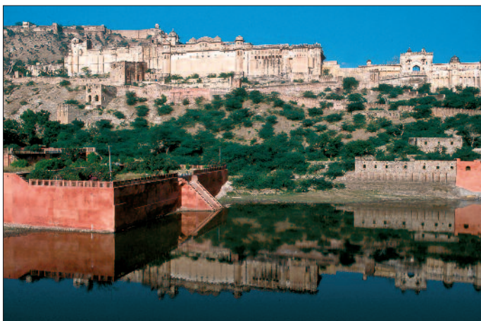
Jaipur, Fort Amber

Hotelunterbringung: wie rechts 'Indien: Rajasthan'