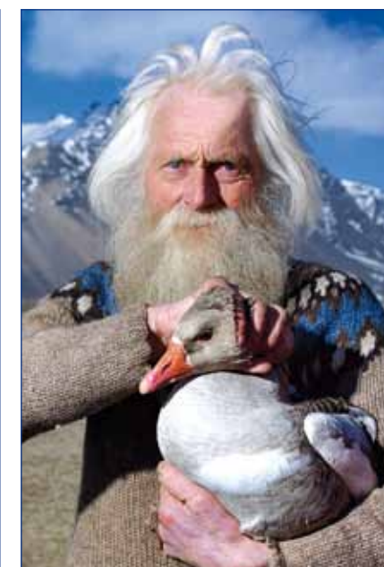
Bauer aus Island