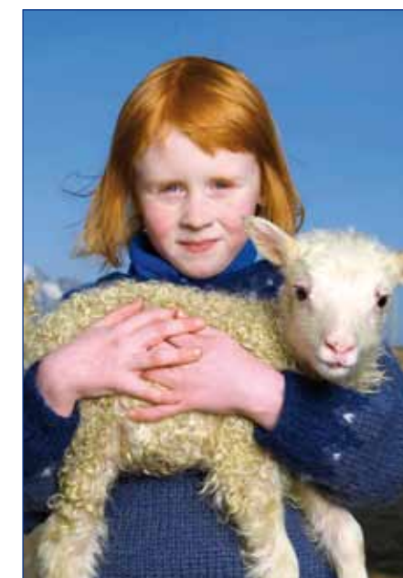
Island, Mädchen aus der Vatnajökull-Region

Mit Wanderungen in den schönsten Nationalparks 16. - 31.7., 30.7. - 14.8., 6. - 21.8.2013 Flug, Geländebus, Hotels und Bauernhöfe/meist HP, Watt-Fahrt, Walbeobachtungs-Bootstour, Eintritte, RL: Mag. Peter Jungmayr (1. Termin) ab € 3.390,-