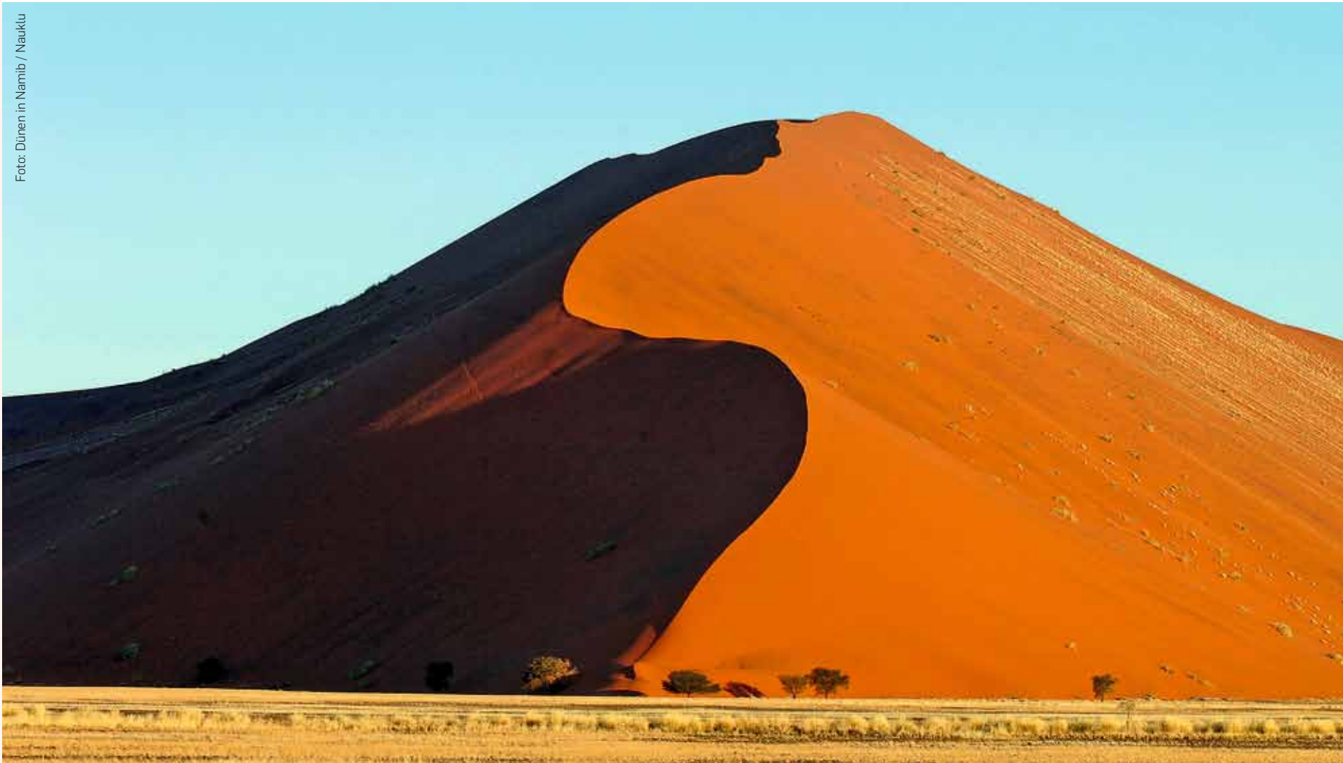
Foto: Dören in Namib / Naaklu