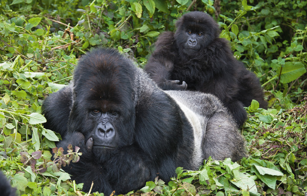
1 Berggorillas