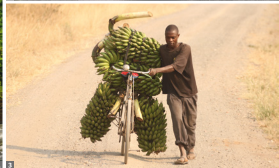
1 Murchison Falls © F.C.G./Fotolia.com 2 Gorilla © Dr. Wolfram Rietschel 3 Bananentransport © Dr. Wolfram Rietschel