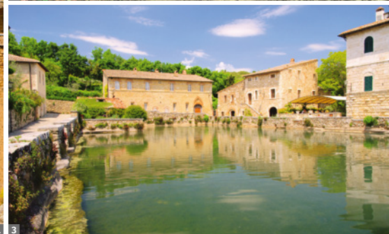
1 Pitigliano 2 „Vie Cave“ nach Sovana 3 Bagni Vignoni

„Etruskerweg“ (ca. 11 km, Gehzeit ca. 4 Std.) von Pitigliano nach Sovana an: Wir passieren zahlreiche, tief in den Tuff geschnittene Höhlen, die früher als Gräber dienten - und heute noch als Keller oder Ställe genutzt werden. Aufgrund ihrer Form wurden die Nekropolen auch als Colombari (Taubenschlag) bezeichnet. Am Nachmittag erreichen wir die etruskische Nekropole bei Sovana mit dem bekannten „Ildebranda-Grab“ - das einzig erhaltene Beispiel eines Tempelgrabs, das aus einem mächtigen Felsblock herausgeschlagen wurde. Der romanische Dom steht exakt an der Stelle des zuerst etruskischen, später römischen Forums und Haupttempels. Am späten Nachmittag Rückfahrt zum Hotel am Monte Amiata.