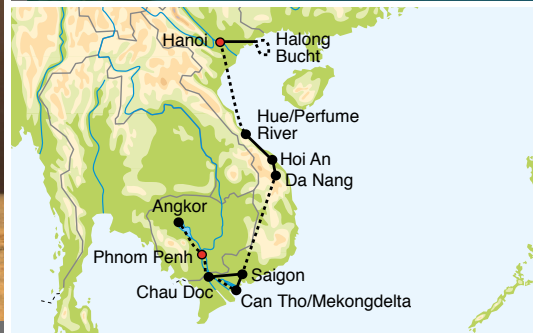
1 Halong-Bucht 2 Hoi An

Sonnenuntergang auf dem Sam Berg genießen.