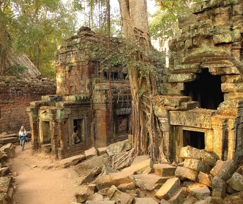
Angkor, Ta Prohm Kloster