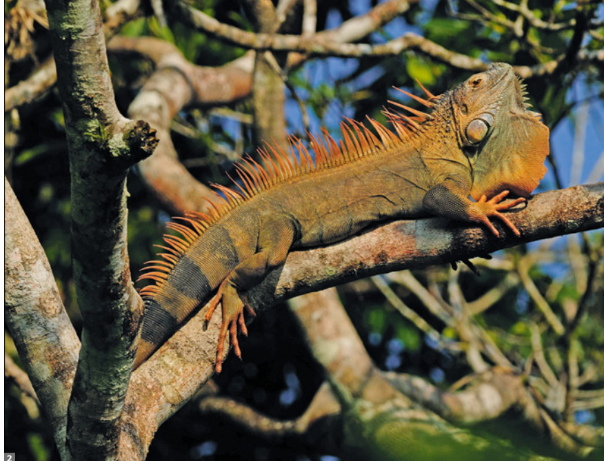
1 Wanderung über den Canopy Walk 2 Grüner Leguan

Blancas-NP. Ein ganztägiger Ausflug führt uns heute in den berühmten „Regenwald der Österreicher“. Hier im Piedras Blancas-Nationalpark wurden von Österreichern seit mehr als 20 Jahren 4000 Hektar Regenwald von Nutzung freigekauft und der Natur zurück gegeben. Wanderung durch Sekundärwald und unberührten Primärwald mit einer Baumdichte von gut 140 Arten pro Hektar und über 2.500 (!) verschiedenen Pflanzenarten. Wir kommen zu einem Wasserfall, sehen wandernde Palmen, Orchideen, Bromelien, Passionsblumen und Lianen. Es bestehen gute Chancen, bunte Vögel wie Trogone und Tukane, leuchtende Schmetterlinge oder sogar Affen, Agutis oder Nasenbären zu sehen. Reine Gehzeit: ca. 1,5 - 4,5 Std., mind. 145m ↑ ↓, ab 2,4 km.