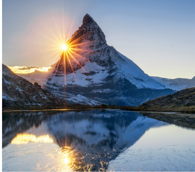
Matterhorn und Riffelsee