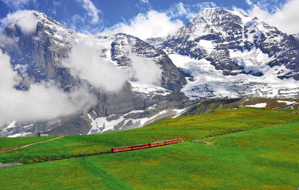
1 Kleine Scheidegg mit Mönch, Eiger und Jungfrau