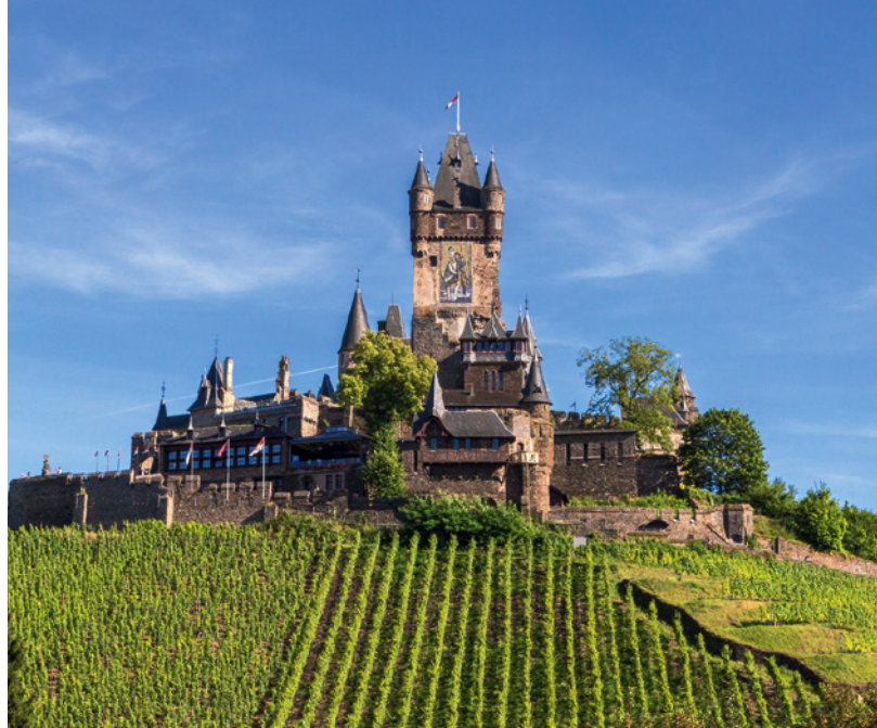
Reichsburg in Cochem an der Mosel