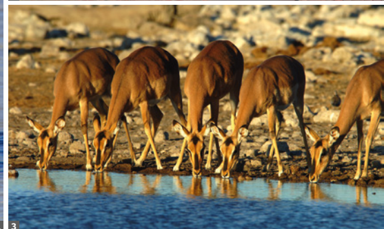
1 Zebras im Etoscha NP © Christian Kneissl 2 Amtsgericht Swakopmund © Christian Kneissl 3 Etoscha-NP, Impalas am Wasserloch © Christian Kneissl