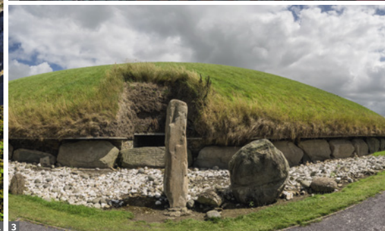
1 Slieve League 2 Titanic Experience 3 Knowth