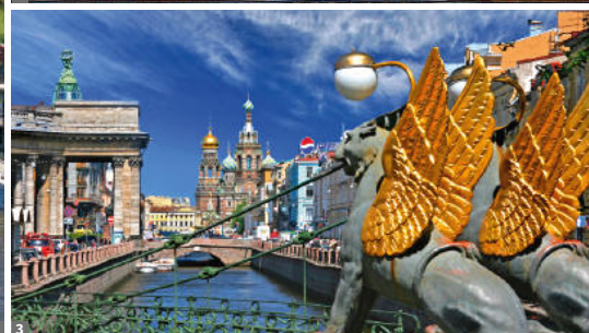
1 Moskau © Foto Julius 2 Moskau, Kreml-Kirche © Foto Julius 3 St. Petersburg, Bank-Brücke © Foto Julius