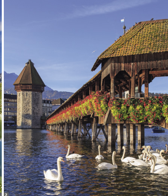
1 Matterhorn und Riffelsee 2 Luzern

geschmückte Patrizierhäuser, Arkadengänge, das Münster, aber auch skurrile Brunnen wie der Kindlifresserbrunnen oder der Gerechtigkeitsbrunnen bestimmen das Stadtbild. Am Nachmittag Fahrt auf der Autobahn durch das Freiburger Land zum Genfer See nach Montreux und weiter zum herrlich gelegenen Schloss Chillon (Halt). Durch das Rhonetal geht es weiter nach Täsch: Täsch liegt nur ca. 6 km von Zermatt entfernt und ist der letzte Ort im Mattertal, der für den Privatverkehr zugelassen ist. Fahrt mit der Bahn zu unserem Hotel in das 1620 m hoch gelegene Zermatt.