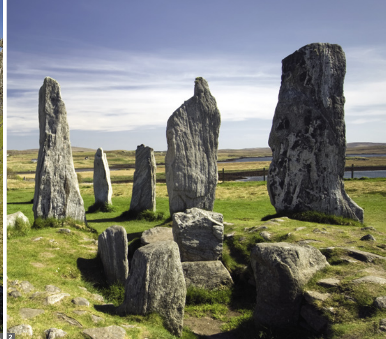
1 Isle of Skye, Old Man of Storr 2 Callanish Stones

Storr“, eine ca. 50 m hohe Felsnadel, bevor wir abends unser Hotel in herrlicher Landschaft im Zentrum der Insel erreichen.