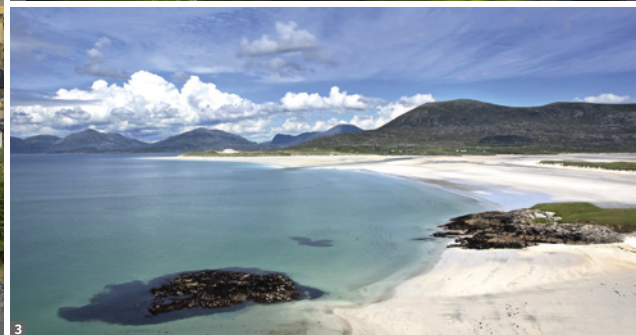
1 Edinburgh 2 Glencoe 3 Isle of Harris