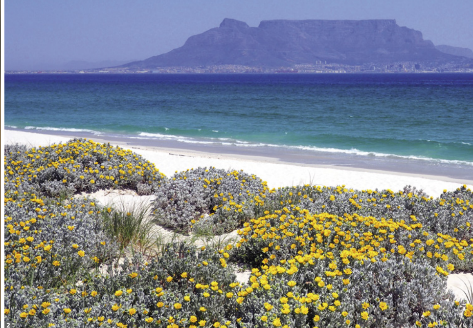
1 Löwe 2 Bloubergstrand

riere aus Speeren“) Drakensberg Park ist Teil des UNESCO-Welterbes.