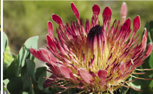
1 Blyde River Canyon © Dirk Bleyer 2 Kapbüffel im Kruger NP © Dirk Bleyer 3 Protea © Christian Kneissl