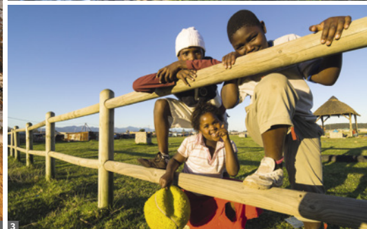
1 Giraffe im Hluhluwe Game Reserve © Christian Kneissl 2 Drakensberge © Dirk Bleyer 3 © Dirk Bleyer