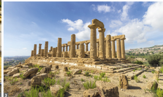
1 Noto 2 Mosaik in der Apsis von Monreale 3 Agrigento, Tal der Tempel