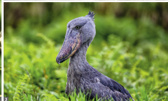
1 Berggorillas 2 Murchison Falls 3 Schuhschnabelstorch