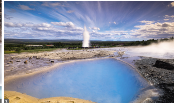
1 Hraunfossar © Dirk Bleyer 2 Eissee Jökulsárlón © Dirk Bleyer 3 Geysirfeld © Dirk Bleyer