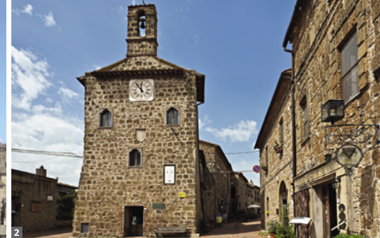
2 Sovana