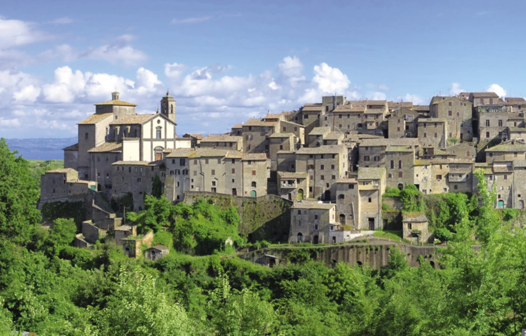
1 Castro