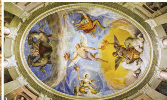
1 Cerveteri 2 Villa Lante 3 Villa Farnese