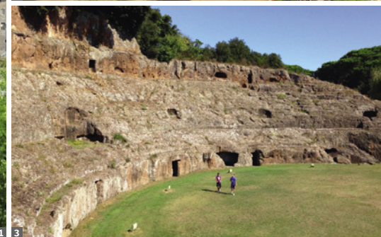
3 Sutri