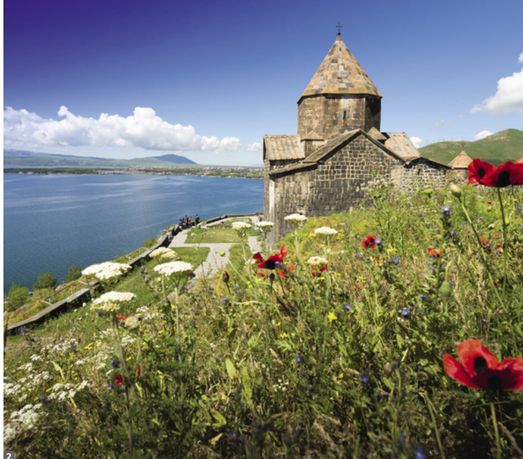
1 Garni-Schlucht 2 Kloster Sevanavank