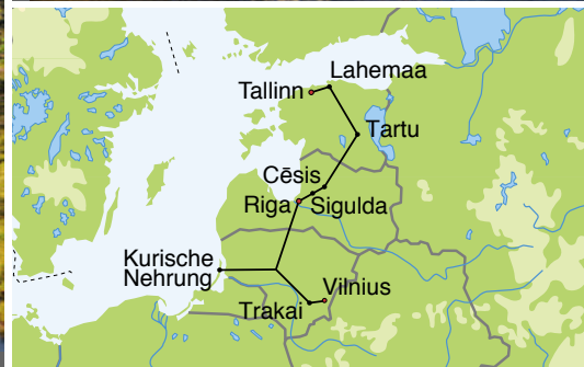
1 Kemeru-Nationalpark 2 Lettland, Riga, Burg

nen: das Rigaer Schloss, den Dom, die Petrikirche - das schönste und eindrucksvollste Gotteshaus der Stadt, die Kleine und die Große Gilde, die prachtvollen Häuser der „Drei Brüder“, das Schwarzhäupterhaus und zahlreiche einzigartige Jugendstilbauten. Am Nachmittag Ausflug nach Jurmala, dem größten Seebad des Baltikums. Besuch des nahen Nationalparks Kemeru, der 1977 gegründet wurde, um die Gewässer, vogelreichen Lagunenseen, Wälder, Wiesen und Dünen rings um Jurmala zu schützen. Eine Wanderung führt uns auf einem Holzsteg vorbei an Moorflächen, Moorkiefern, Wassertümpeln und dunklen kleinen Seen. Am Abend Rückfahrt nach Riga. Gehzeit ca. 1 Std. (3 km)