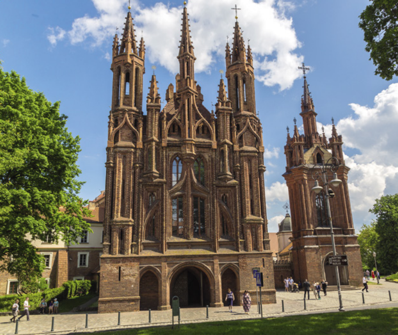
Vilnius, Annenkirche