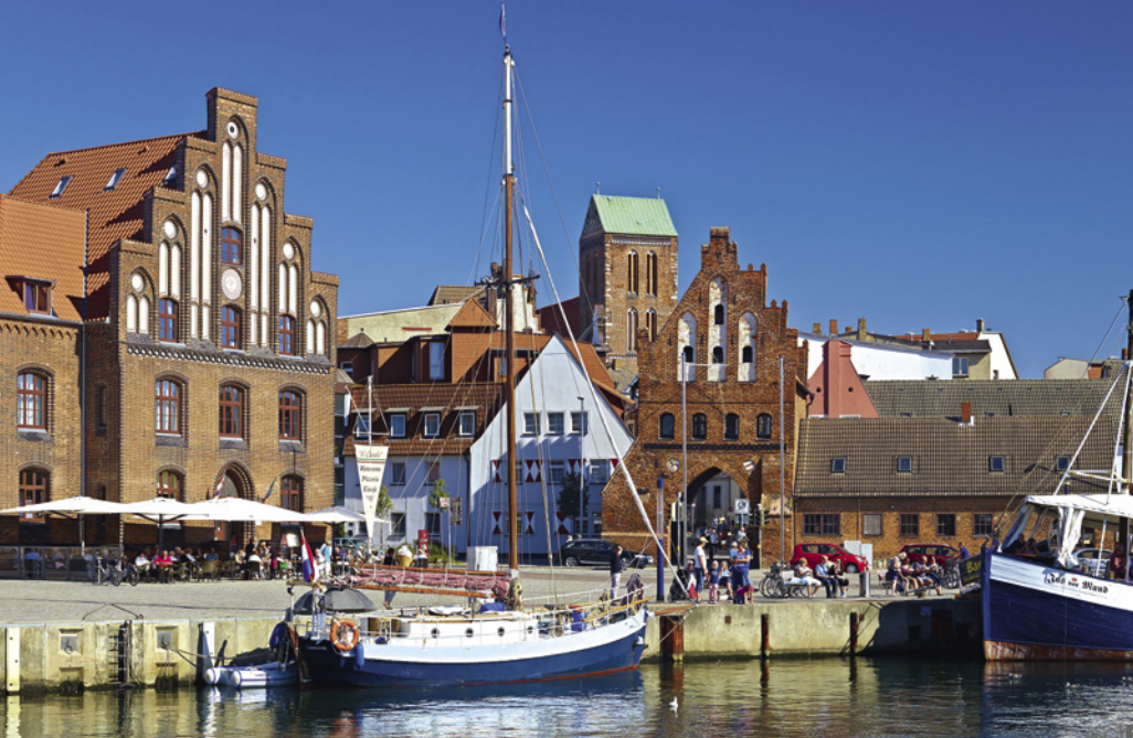
1 Wismar