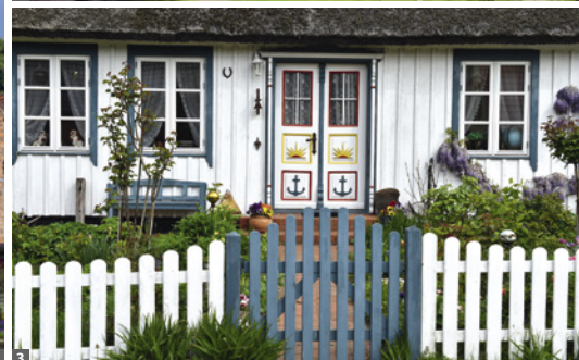
1 Holstentor, Lübeck 2 Münster in Bad Doberan 3 Haus in Zingst

kolonie Ahrenshoop sowie die Bernsteinstadt Ribnitz-Damgarten, wo wir das deutsche Bernsteinmuseum besuchen. Am Abend erreichen wir die Hansestadt Rostock.