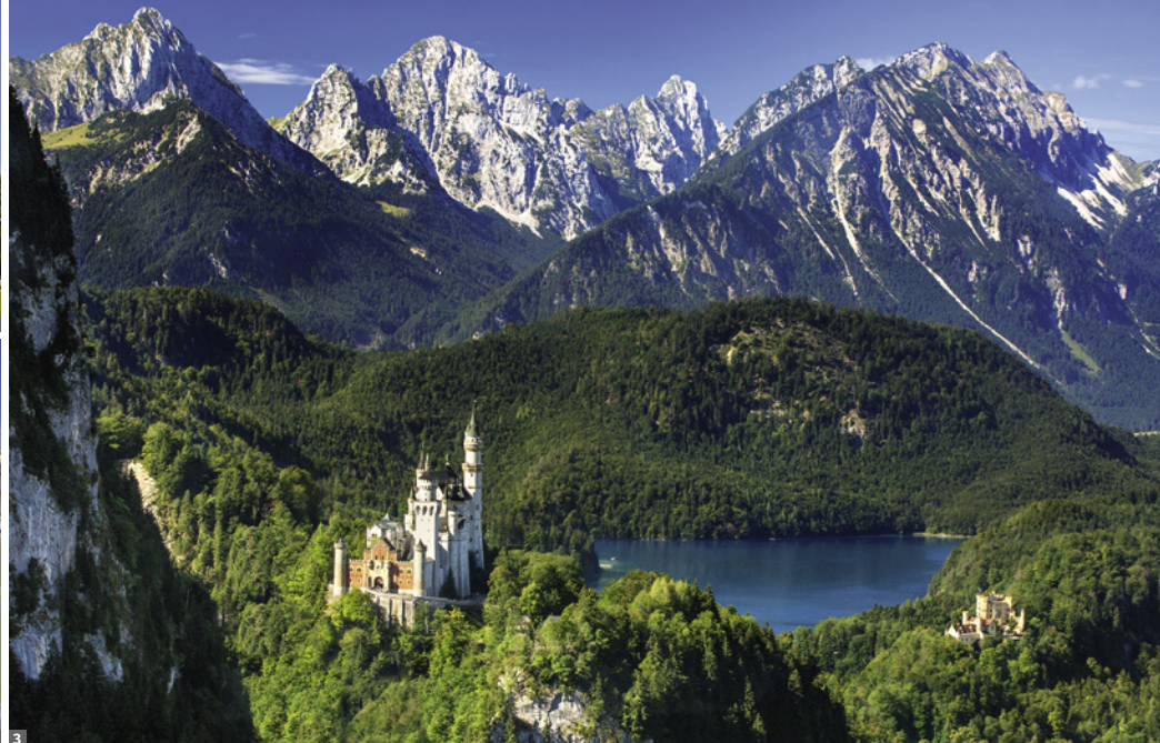
1 Wieskirche 2 Herrenchiemsee 3 Neuschwanstein