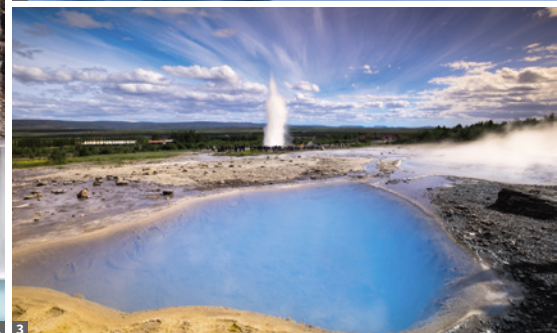
1 Hraunfossar © Dirk Bleyer 2 Eissee Jökulsárlón © Dirk Bleyer 3 Geysirfeld © Dirk Bleyer