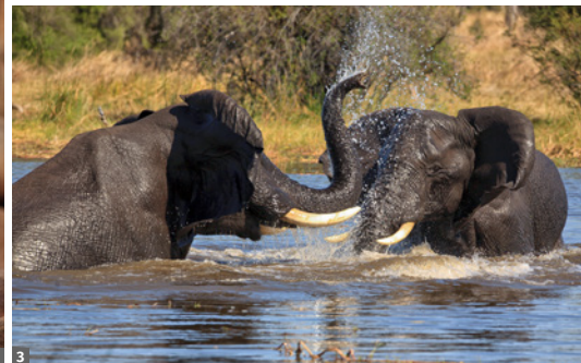
1 Robbenkolonie mit Schakal am Cape Cross © Mag. Peter Brugger 2 Sandsteinberge der Tsodilo Hills © Mag. P. Brugger 3 Elefanten, Chobe River © Mag. P. Brugger