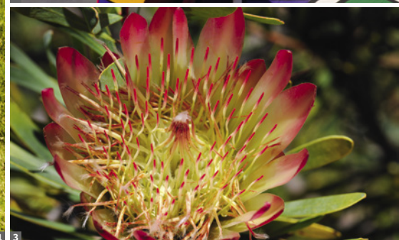
1 Kruger NP © Dirk Bleyer 2 Ndebele-Frau © Dirk Bleyer 3 Protea © Christian Kneissl