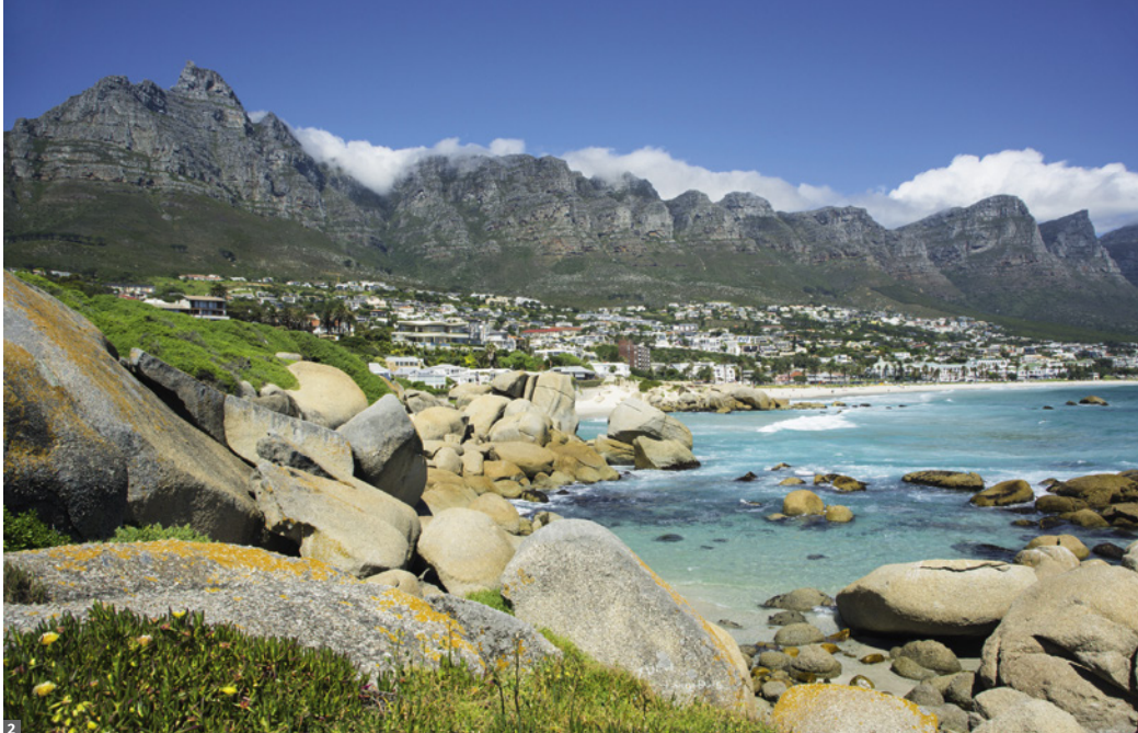
1 Löwe 2 „Zwölf Apostel“

Weinverkostung im Weingut Groot Constantia, einem schönen kap-holländischen Bau, lernen wir den ausgezeichneten Wein der Region kennen.