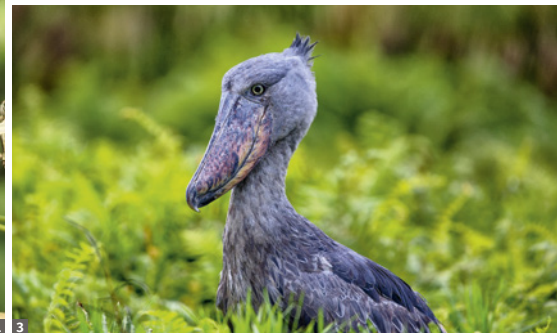
1 Berggorillas 2 Murchison Falls 3 Schuhschnabelstorch