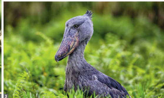
1 Berggorillas 2 Murchison Falls 3 Schuhschnabelstorch