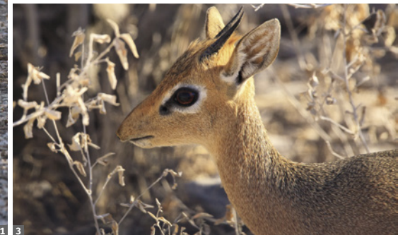
1 Geparden im Etosha NP © Mag. Peter Brugger 2 Zwergflamingo, Walvis Bay © Mag. Peter Brugger 3 Dikdik im Damaraland © Mag. Peter Brugger

1484 errichten ließ, der als erster Europäer die Küste Namibas erreicht hatte. Nächtigung in der am Atlantik gelegenen Cape Cross Lodge.