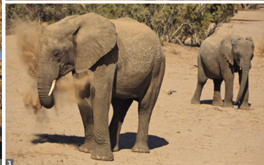
1 Spitzkoppe © Mag. Peter Brugger 2 Robbenkolonie mit Schakal/Cape Cross © Mag. Peter Brugger 3 Wüstenelefanten © Mag. P. Brugger