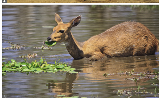
1 Elefanten am Okaukuejo Wasserloch © Mag. Peter Brugger 2 Dead Vlei © Mag. Peter Brugger 3 Buschbock am Okavango © Mag. Peter Brugger

an die Grenze zu Botsuana und weiter nach Kasane, das direkt am Chobe-Fluss liegt. Der Chobe Nationalpark (11.000 km 2 ), einer der wildreichsten und schönsten Nationalparks weltweit, beherbergt riesige Elefanten- und Büffelherden sowie zahlreiche Raubtiere. Am Nachmittag unternehmen wir eine Bootsfahrt am Chobe-Fluss, um zunächst die einzigartige Vogelwelt kennenzulernen. Wir versuchen dabei, Schlangenhalsvögel, Reiherarten, Seeadler, Eisvögel, Marabus u.v.m. vor die Linse zu bekommen. Aber natürlich sind auch die großen Elefantenherden sowie der Sonnenuntergang über dem Chobe Fluss besondere Highlights. Nächtigung in der Chobe Bush Lodge.