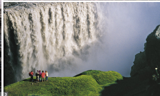
1 Geysir Strokkur 2 3 Dettifoss