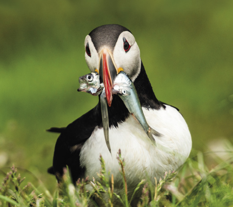
Papageitaucher © Dirk Bleyer