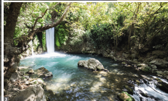
1 Felsendom © bargotipphoto/stock.adobe.com 2 Schlucht En Avdat © andrey_iv/stock.adobe.com 3 Banias-Quellen © andrey_iv/stock.adobe.com