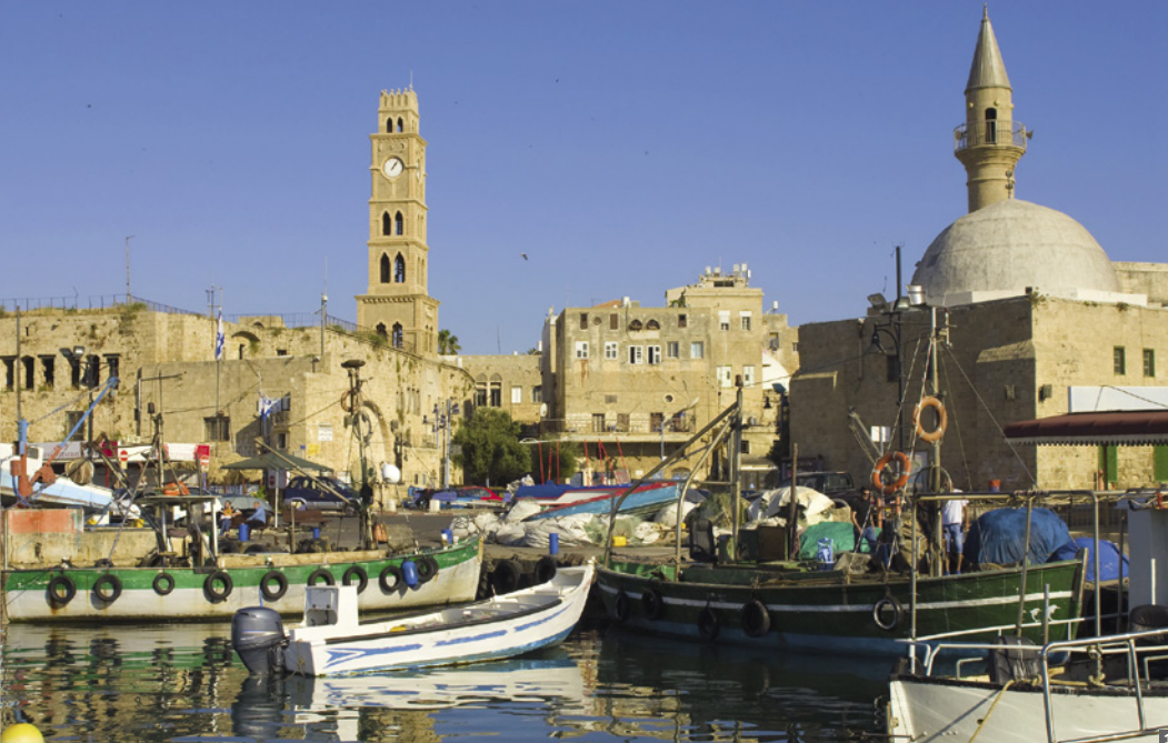
1 Akko