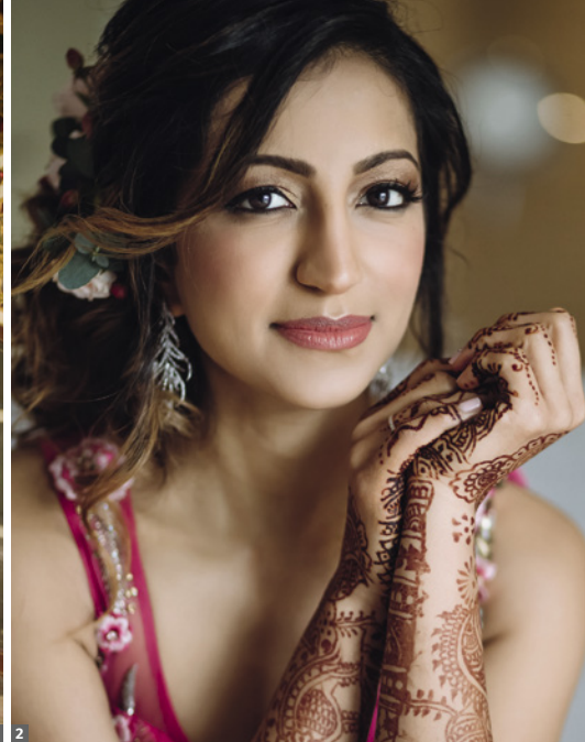
1 Jaipur Palast 2 Hindu-Braut