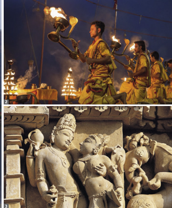
1 Jal Mahal, Jaipur 2 Aarti-Zeremonie, Varanasi 3 Varanasi