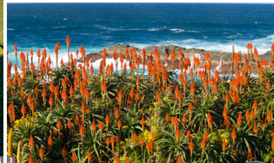
1 Blyde River Canyon © Dirk Bleyer 2 Zulu-Mädchen © Dirk Bleyer 3 Aloes © Dirk Bleyer