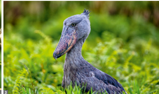
1 Berggorillas 2 Murchison Falls 3 Schuhschnabelstorch