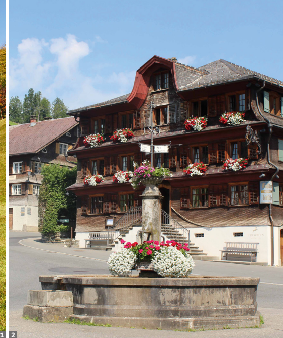
1 Montafon 2 Bregenzer Häuser in Schwarzenberg