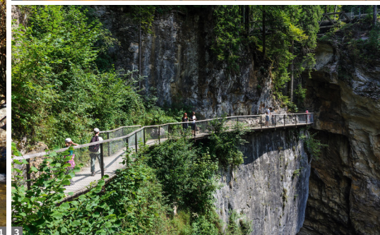
1 Silbertal 2 Einsiedeln 3 Rappenlochschlucht

Kristberg. Besuch der St. Agatha Bergknappenkapelle - hier wird die Geschichte des Silberabbaus, von dem das Silbertal seinen Namen hat, wieder lebendig. Auf gleichem Weg geht es zurück (7 km, ca. 2 h Gehzeit, 280 m ↓ ↑). Am Nachmittag unternehmen wir einen Rundgang durch das mittelalterliche Feldkirch mit der berühmten Schattenburg.