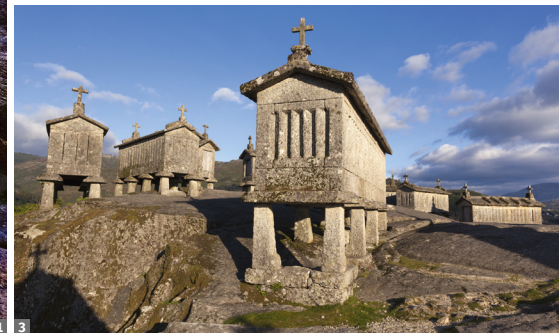
1 Peneda Gerês NP 2 Douro-Tal 3 Maisspeicher