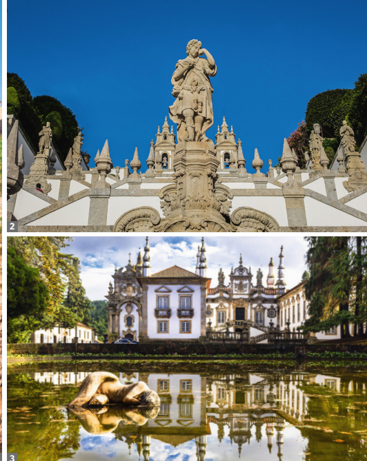
1 Kap São Vicente 2 Bom Jesus 3 Solar de Mateus

13. Tag: Albufeira - Faro - Frankfurt/München - Wien/Linz/Graz/Salzburg/München. Möglichkeit zu einer individuellen Verlängerung an der Algarve (siehe rechts, Seite 115). Transfer zum Flughafen Faro - Abflug um ca. 13.50 Uhr über Frankfurt bzw. München nach Österreich bzw. München.