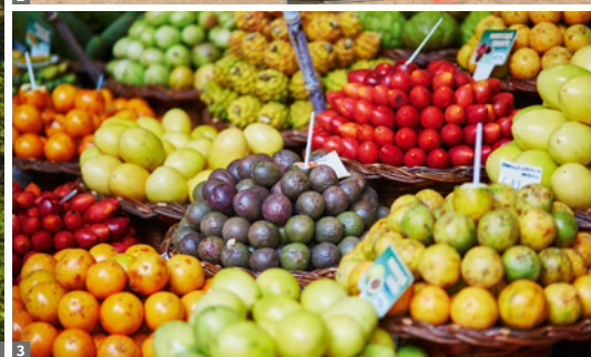
1 Nordküste 2 Câmara de Lobos 3 Funchal, Markt

Std., São Lourenço: Untergrund steinig, erdig, unbefestigt.