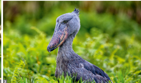
1 Berggorillas 2 Murchison Falls 3 Schuhschnabel