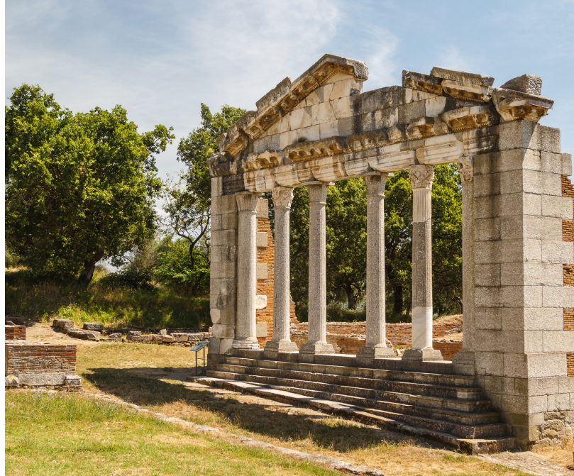
Apollonia © - stock.adobe.com