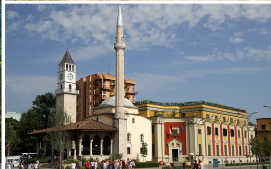
1 Blaues Auge/Syri i Kaltër 2 Gjirokastra 3 Tirana

sche Badeanlage, eine Basilika und eines der größten Baptisterien der antiken Welt.