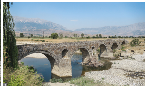
1 Valbona-Tal © Anton Eder 2 Sophienkirche, Ohrid © Anton Eder 3 Bogenbrücke bei Gjirokastra © Anton Eder

passieren gewaltige Schluchten - die den Vergleich mit den Yangzi-Schluchten nicht scheuen müssen. In Fierzë haben wir wieder festen Boden unter den Füßen und fahren über Bajram Curri in den Nationalpark Valbona-Tal. Der klare Wildbach und die 2400 m hohen Berggipfel bilden eine ideale Kulisse für kurze, aussichtsreiche Wanderungen.