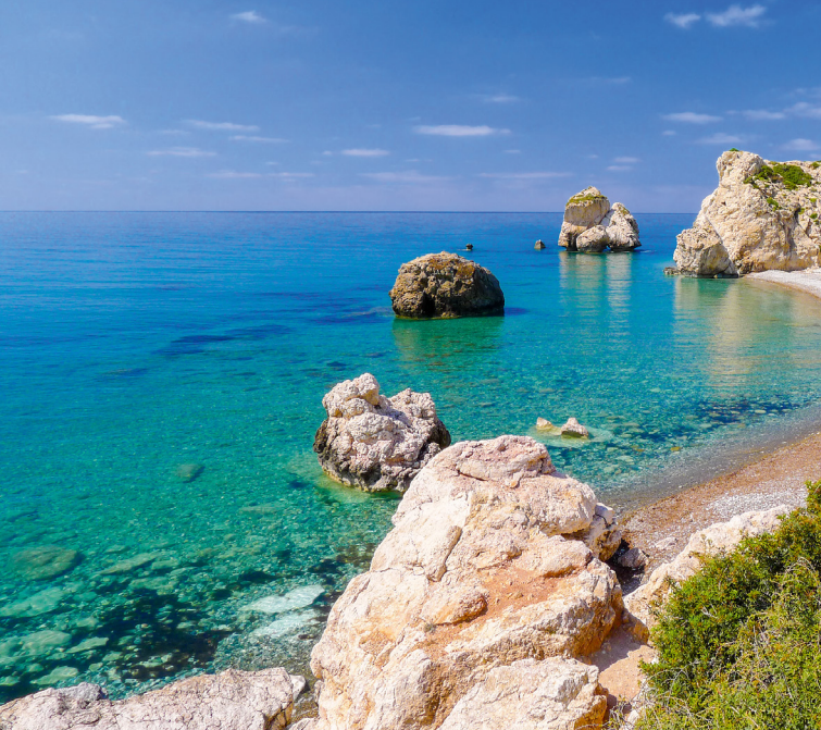
1 Petra tou Romiou