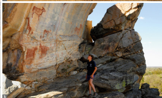
1 Elefanten am Okaukuejo Wasserloch © Mag. Peter Brugger 2 Dead Vlei © Mag. Peter Brugger 3 Tsodilo Hills © Africa Media Online / Alamy

Chobe-Fluss liegt. Der Chobe Nationalpark (11.000 km 2 ), einer der wildreichsten und schönsten Nationalparks weltweit, beherbergt riesige Elefanten- und Büffelherden sowie zahlreiche Raubtiere. Am Nachmittag unternehmen wir eine Bootsfahrt am Chobe-Fluss, um zunächst die einzigartige Vogelwelt kennenzulernen. Wir versuchen dabei, Schlangenhalsvögel, Reiherarten, Seeadler, Eisvögel, Marabus u.v.m. vor die Linse zu bekommen. Aber natürlich sind auch die großen Elefantenherden sowie der Sonnenuntergang über dem Chobe Fluss besondere Highlights. Nächtigung in der Chobe Safari Lodge.