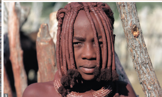
1 Geparden im Etosha NP © Mag. Peter Brugger 2 Wüstenelefanten © Mag. Peter Brugger 3 Himba-Junge © Christian Kneissl

wir auch ein Padrão, ein Steinkreuz, das der Portugiese Diogo Cão 1484 errichten ließ, der als erster Europäer die Küste Namibas erreicht hatte. Nächtigung in der am Atlantik gelegenen Cape Cross Lodge.