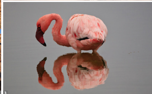
1 Spitzkoppe © Mag. Peter Brugger 2 Robbenkolonie mit Schakal/Cape Cross © Mag. Peter Brugger 3 Zwergflamingo, Walvis Bay © Mag. P. Brugger