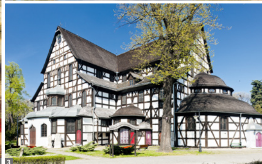
1 Danzig 2 Masuren 3 Friedenskirche Schweidnitz

Abend erreichen wir schließlich die einzigartige Stadt Danzig.