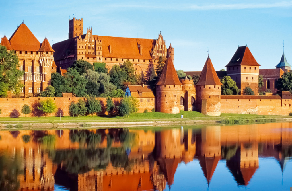
1 Marienburg