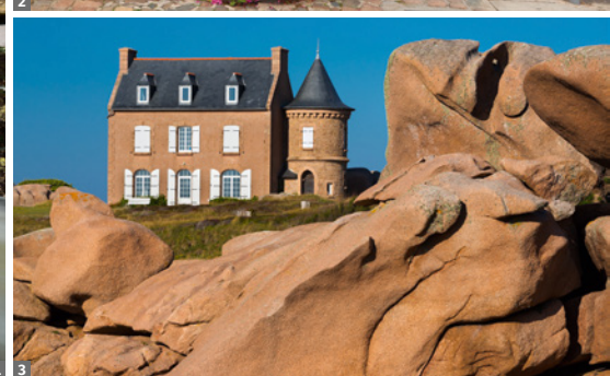
1 Küste bei Étretat © Mag. Günter Grüner 2 Haus in Tréguier © Elisabeth Kneissl-Neumayer 3 Rosa Granitküste © Mag. Günter Grüner